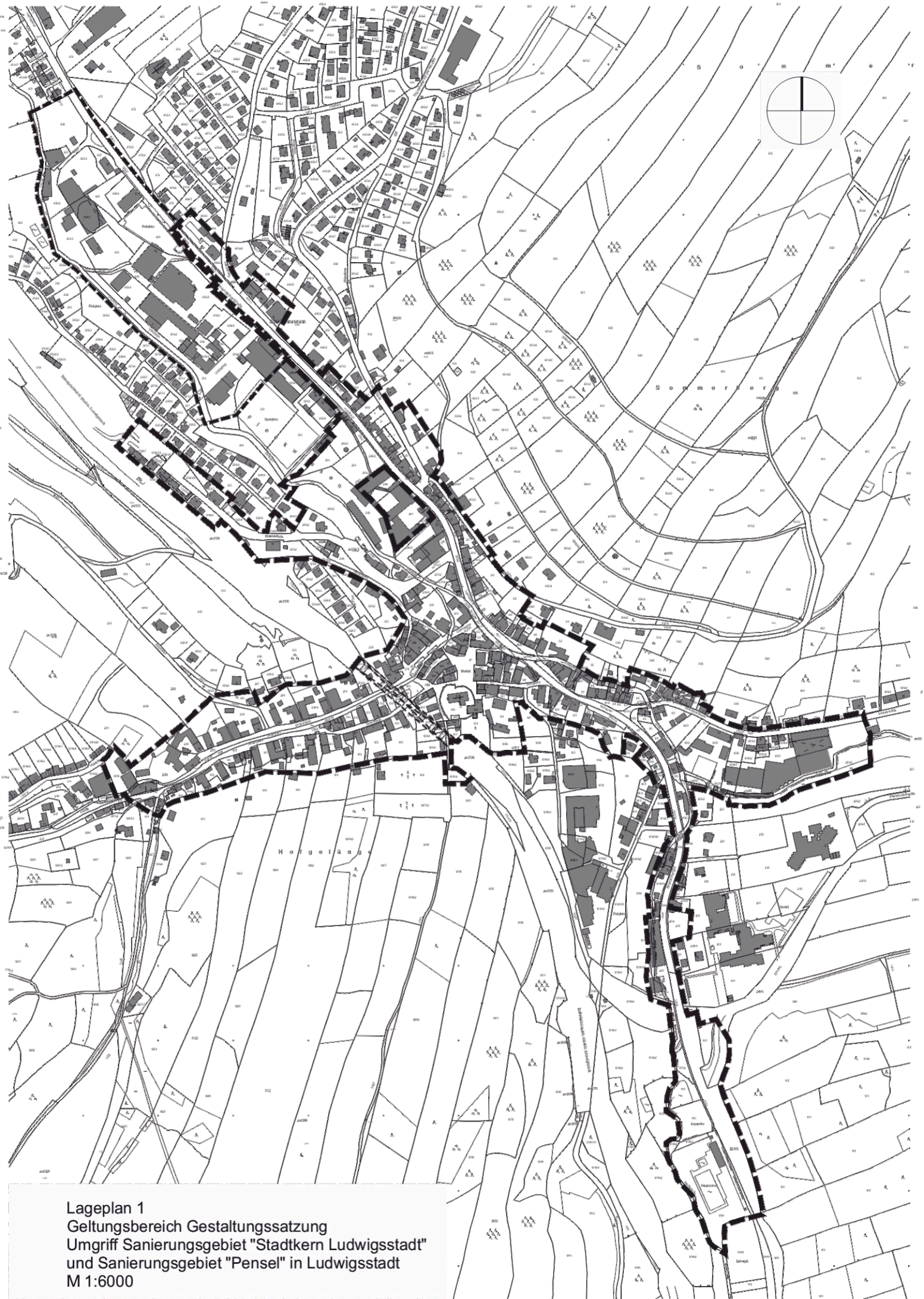
Lageplan 1 Geltungsbereich Gestaltungssatzung Umgriff Sanierungsgebiet "Stadtkern Ludwigsstadt" und Sanierungsgebiet "Pensel" in Ludwigsstadt M 1:6000