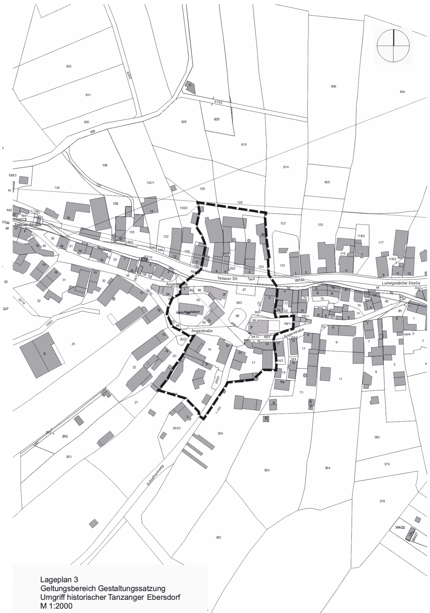
Lageplan 3 Geltungsbereich Gestaltungssatzung Umgriff historischer Tanzanger Ebersdorf M 1:2000