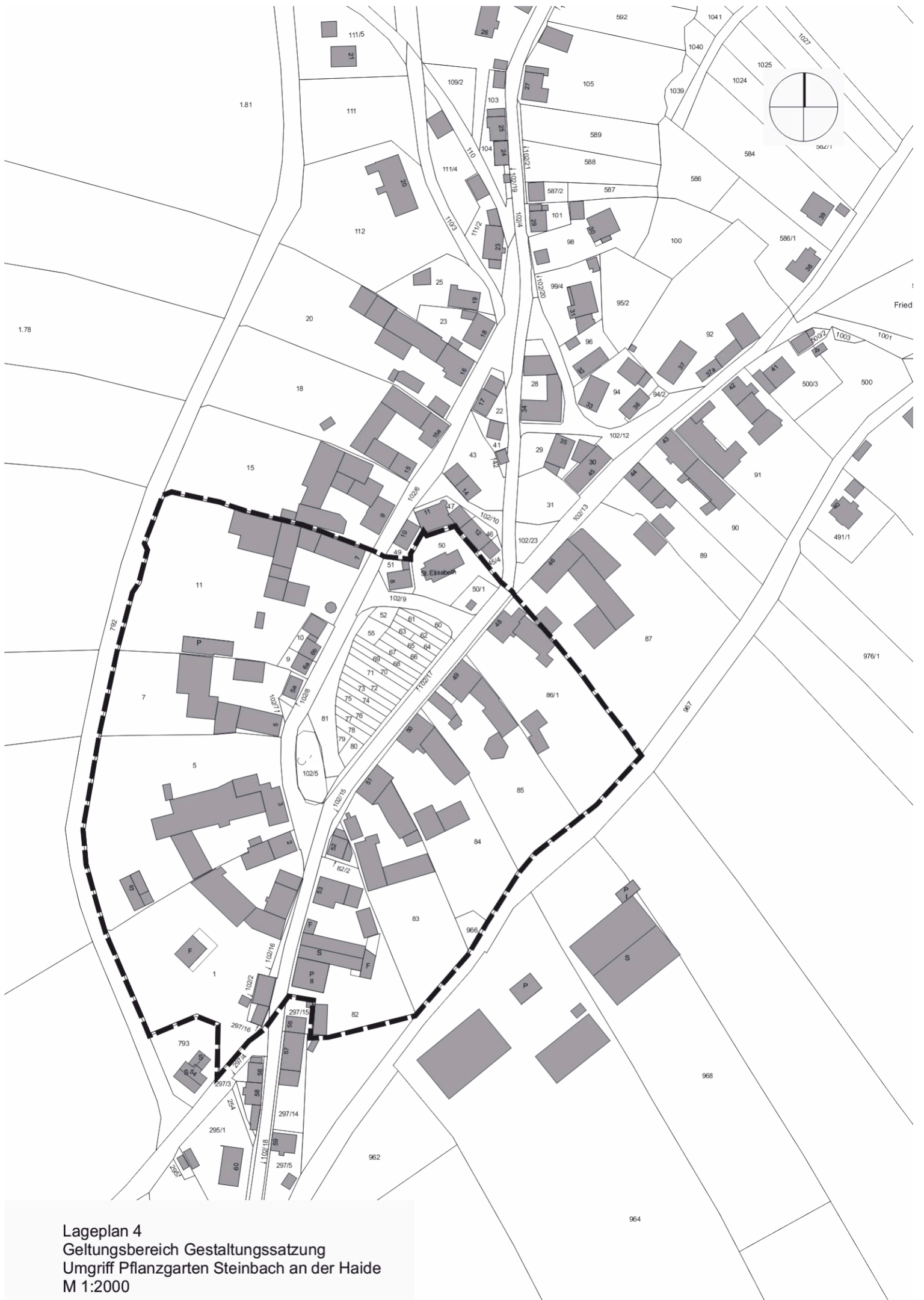
Lageplan 4 Geltungsbereich Gestaltungssatzung Umgriff Pflanzgarten Steinbach an der Haide M 1:2000