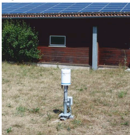
Die Abbildung zeigt die nebenamtliche Niederschlagsstation des DWD in Speichersdorf und ist mit der geplanten Station vergleichbar.

Ehrenamtliche Beobachter/innen müs- sen im Winter -möglichst um 6:50 Uhr- den Schneebedeckungsgrad bestim- men, die Schneedeckenhöhe und den Wassergehalt des Schnees messen und diese Daten dann täglich in eine Inter- netanwendung eingeben. Die übrigen Messdaten werden per LTE automatisch zur Zentrale des DWD nach Offenbach übermittelt. Einfache Pflegearbeiten am Messgerät sind gelegentlich durch den Beobachter/in vorzunehmen. Tech- nische Wartungsarbeiten werden durch die Mitarbeiter/innen des DWD über- nommen. Die Kosten für die Aufstellung der Station und die Datenübertragung trägt der DWD.