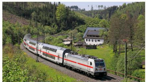
Ein Intercity unterwegs im Frankenwald.

Die Fahrten in den doppelstöckigen Intercity 2-Zügen bieten dabei Platz für 462 Fahrgäste, neun Fahrrad- und zwei Rollstuhlplätze. Auch gibt es WLAN sowie einen gastronomischen Service am Platz. Für die Intercity-Fahrten sind oftmals die besonders günstigen Sparpreise erhältlich.