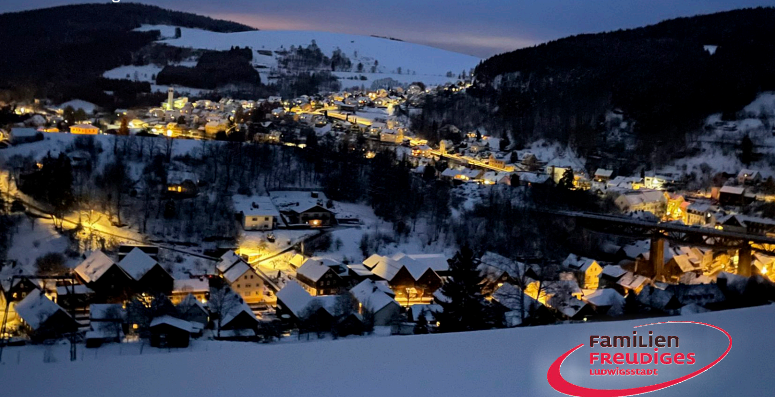
Timo Ehrhardt Erster Bürgermeister