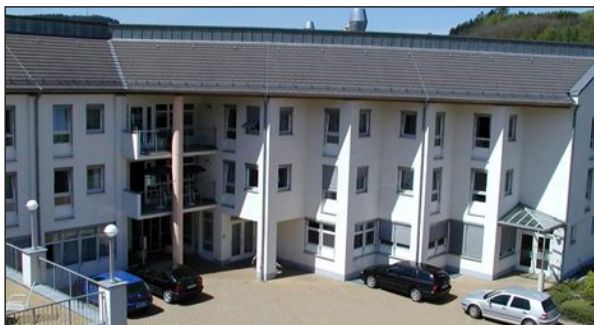
Kat-Leuchtturm Sport- und Kulturhalle Ebersdorf