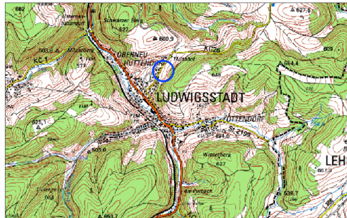
Übersichtskarte ohne Maßstab

■ Biotop der bayer. Biotopkartierung mit Nummer 5534-1015-009